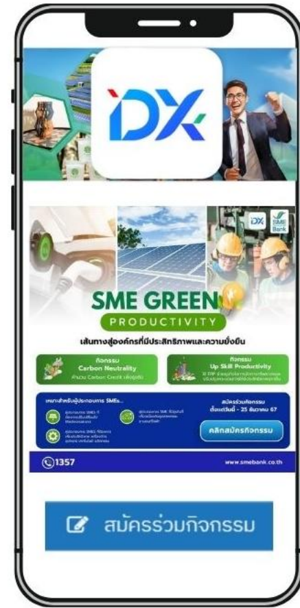
4. พร้อมรับการพัฒนาเพิ่มประสิทธิภาพธุรกิจสีเขียวผ่าน DX Platform