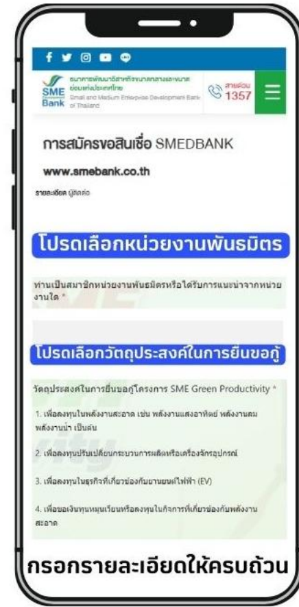
2. กรอกข้อมูลรายละเอียดของธุรกิจ , เลือกหน่วยงานพันธมิตร และ วัตถุประสงค์ในการขยืมกู้