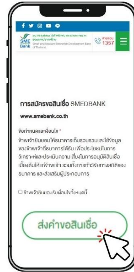
3. กดส่งคำขอสินเชื่อหลังกรอกข้อมูลเสร็จเรียบร้อยแล้ว