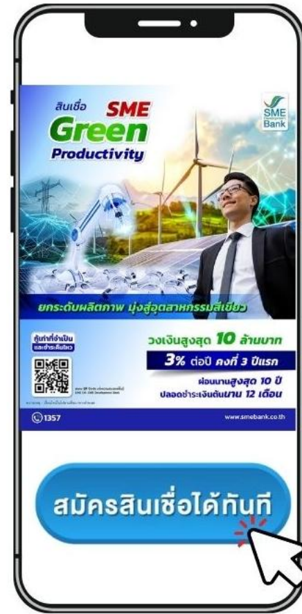
1. เลือกสมัครสินเชื่อ