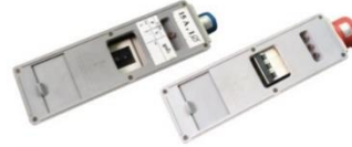
ลำดับ 3 - 10 เมรกเกอร์ ลำดับ 1-6 Section C : เมรกเกอร์ตัดหลอดไฟที่แสงสว่าง